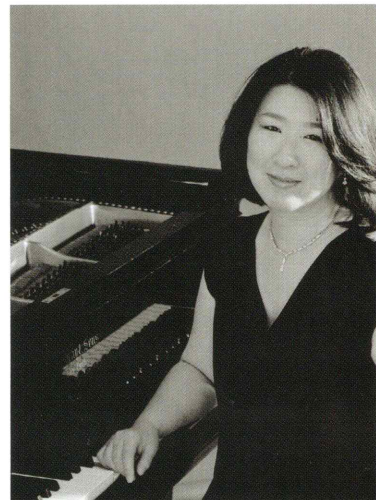
スペシャルゲスト：坂本 知穂