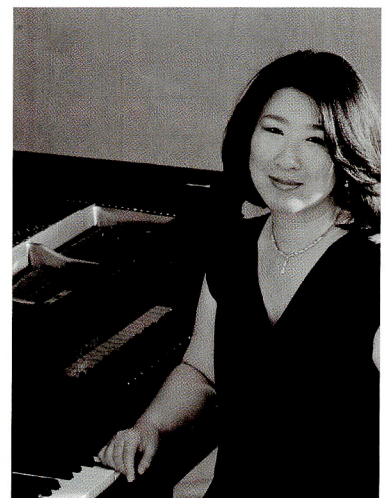
スペシャルゲスト：坂本 知穂